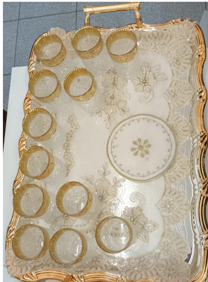
Servizio di pregiati bicchieri