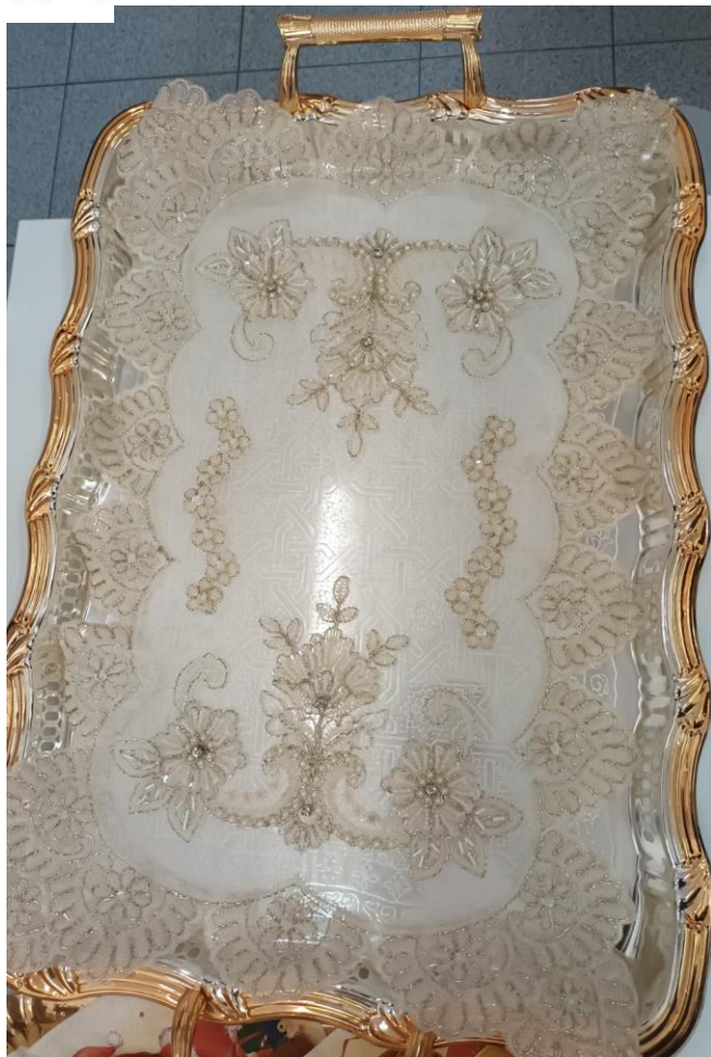
Vassoio impreziosito da ricami